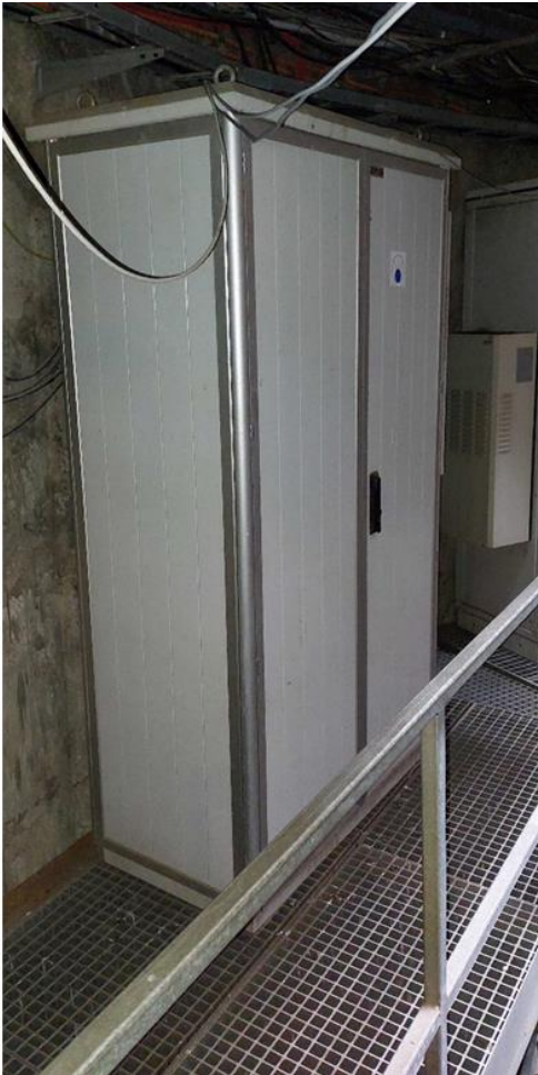
Widok z zewnątrz